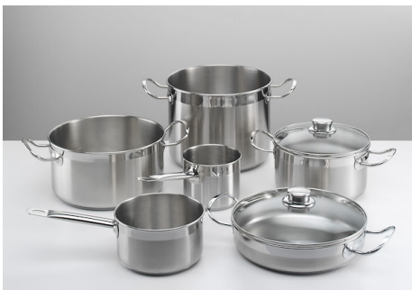
Induction Pro 锅具套装 8件